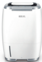
Luftwäscher IDEAL AW60