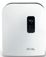
Luftwäscher IDEAL AW40

Markus Magikus, der grüne Zauberer, hilft dabei, die Luft im Kinderzimmer sauber zu halten. Den IDEAL AP15 gibt es jetzt mit entsprechendem Motiv-Sticker.