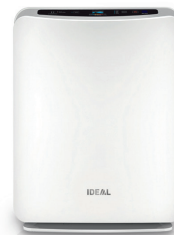
Luftreiniger IDEAL AP15/30/45