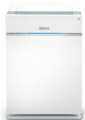
Luftreiniger IDEAL AP40