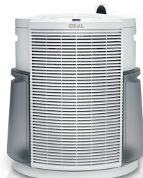
Kombigerät IDEAL ACC55