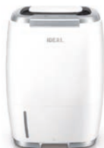
Luftwäscher IDEAL AW60