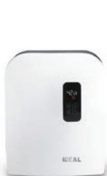
Luftwäscher IDEAL AW40

Eine Geruchsneutralisation der Praxisluft führt zum Wohlbefinden der Patienten bei. Der Besuch beim Zahnarzt artet bei vielen Menschen in Stress aus. 70% aller Deutschen haben Angst vor dem Zahnarzt, rund 10% Prozent fürchten sich sogar sehr. Auch Zahnärzte sind besonders gefordert, wenn ein ängstlicher und angespannter Patient auf dem Stuhl sitzt. Fragt man Angstpatienten nach den Gründen für ihre Anspannung, wird neben der Angst vor schmerzhaften Behandlungen, sehr häufig auch der typische Geruch in den Praxen als Auslöser genannt.