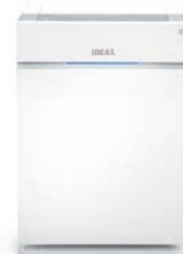
Luftreiniger IDEAL AP40