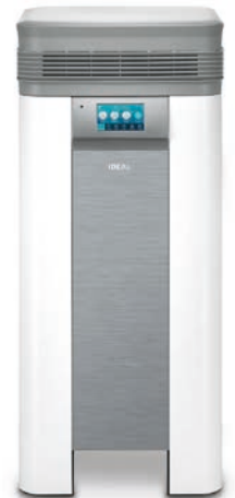
Luftreiniger IDEAL AP100