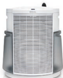
Kombigerät IDEAL ACC55