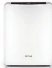
Luftreiniger IDEAL AP15/30/45